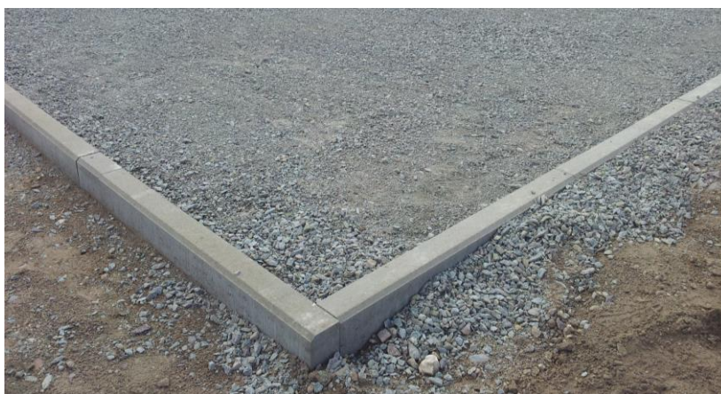
Figura 1: Base preparada con margen

Al utilizar una cola adecuada de poliuretano de dos componentes, arena de cuarzo y granulado de relleno, así como otros materiales adicionales y aditivos, observe las indicaciones del fabricante del producto.