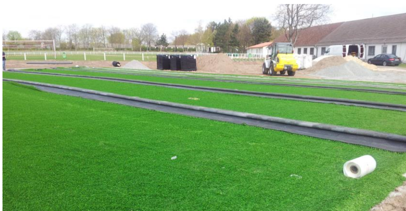
Figura 4: Desenrollar el recubrimiento de césped artificial

¡Estas instrucciones de colocación no están sujetas a ninguna modificación! Todas las especificaciones sin garantía. La versión actual vigente puede consultarse en www.kraiburg-relastec.com/sportec