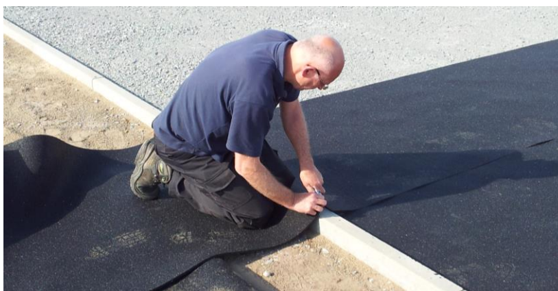
Figura 3: Cortar el saliente del recubrimiento elástico