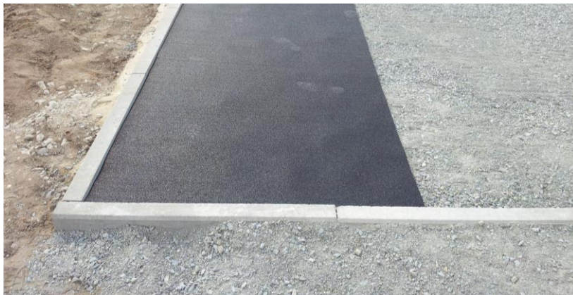
Figura 2: Empezar a colocar por el margen