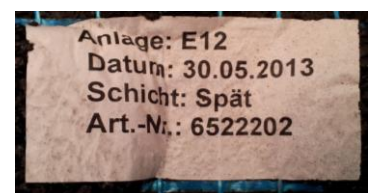
Figura 3: Lote de producción

Presente de inmediato su reclamación y detenga enseguida la instalación en caso de recibir producto erróneo o defectuoso, que la cantidad incorrecta o detecte otros posibles fallos. Solo es posible realizar la reclamación de materiales suministrados si estos no se han modificado y se indica el lote de producción. Se encuentra impreso sobre una etiqueta en la parte inferior de la plancha, véase figura 3.