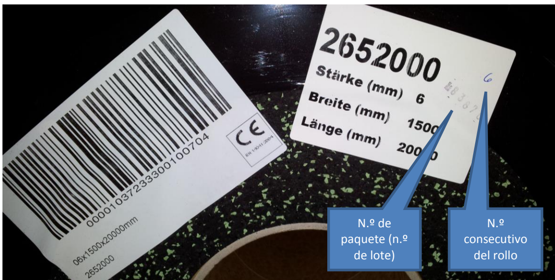
Figura 4: Rotulación de los rollos con el número de paquete y de rollo

Presente de inmediato su reclamación y detenga enseguida la instalación en caso de recibir producto erróneo o defectuoso, que la cantidad incorrecta o detecte otros posibles fallos. Solo es posible realizar la reclamación de materiales suministrados si estos no se han modificado y se indica el lote de producción (véase figura 4).