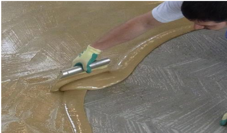
Figura 1: Aplicación de la cola sobre la base

En caso necesario, limpie y elimine cualquier tipo de suciedad del revestimiento antes de aplicar el sellado. No se puede pisar el revestimiento hasta que la capa de sellado se haya endurecido por completo.