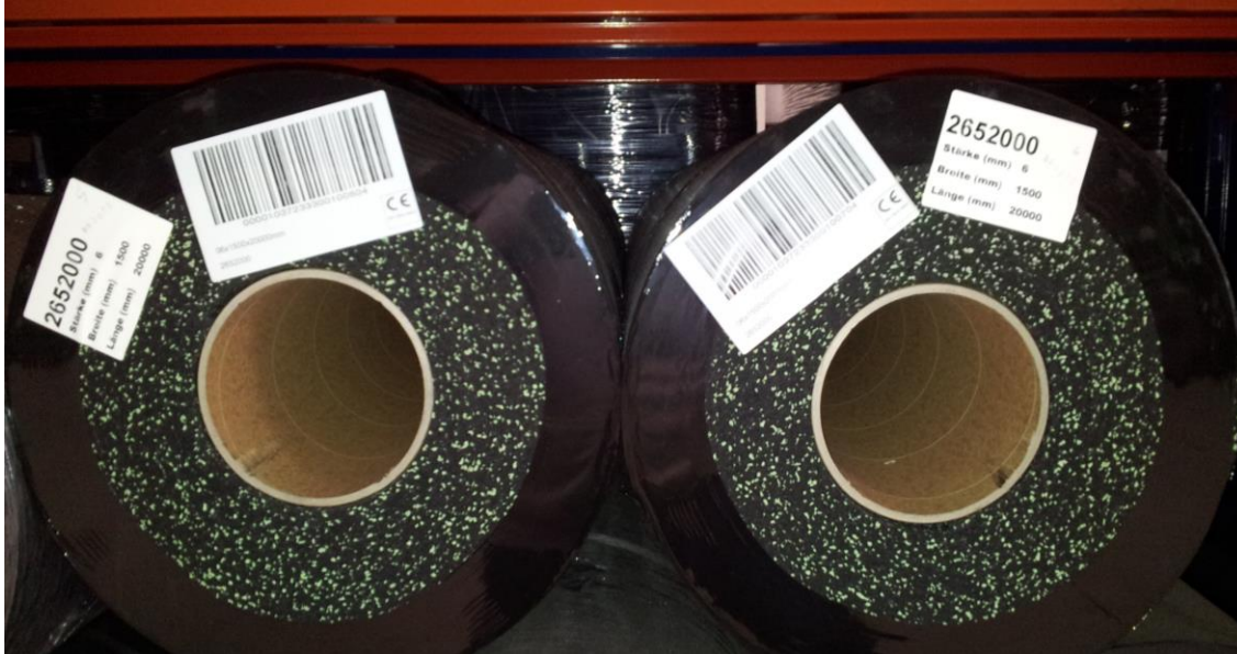
Figura 3: Durante la colocación observar especialmente el lote (ver etiquetas)